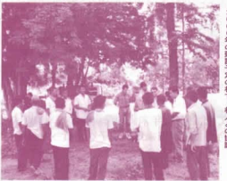
カンボジアの子どもたちとボランティアスタッフ