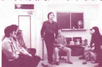
毎月第三火曜日に行われている例会

毎月第三火曜日に行われている例会に、10月19日は珍しくお客様をお迎えしました。